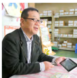
アイハラ貿易株式会社 代表取締役