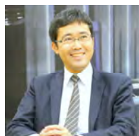
株式会社シーネット 営業本部第二営業部 部長

株式会社ゼンク 神奈川県川崎市幸区柳町1番地 伸幸ビル5F http://zenk.co.jp/