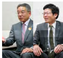
百十四銀行 徳島支店 支店長